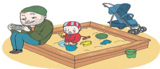
Illustration: Lotta Sjöberg, Statens medieråd 2016.

De flesta treåringar har varit på nätet och 42 procent av femåringarna använder internet minst några gånger i veckan. Nu har Statens medieråd tagit fram ett pedagogiskt material för barnvårdscentralerna, som kan användas i mötet med småbarnsföräldrar.